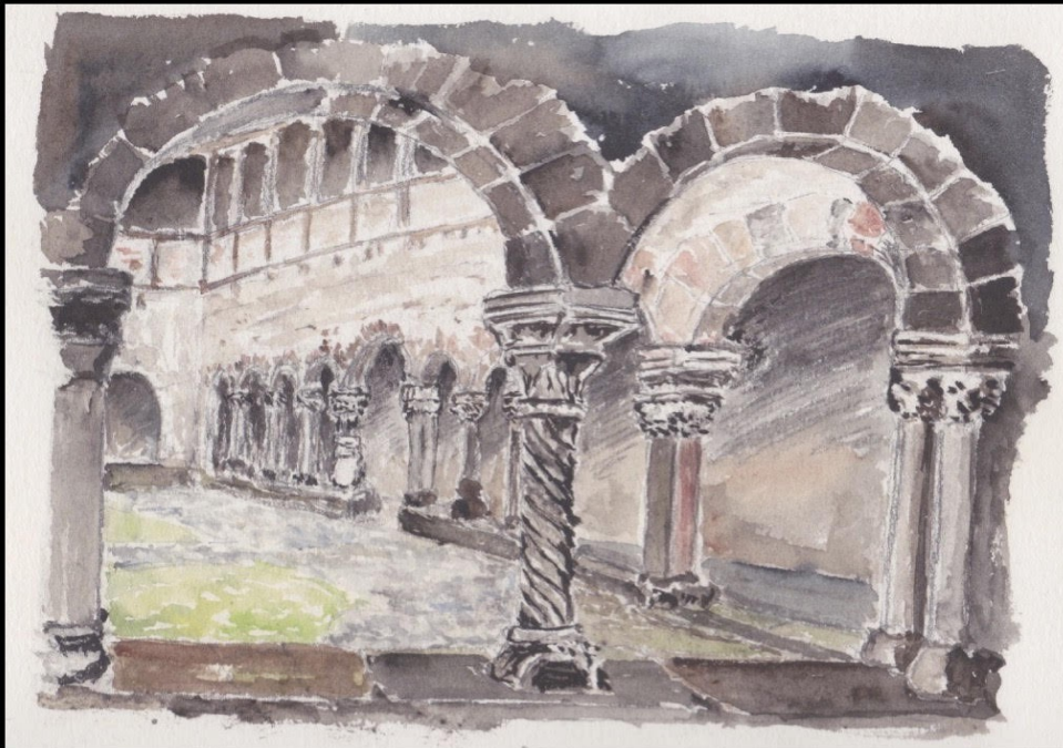
Abbaye de Lavaudieu Le cloître