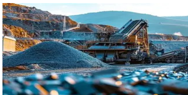
SCHLICH minéral broyé