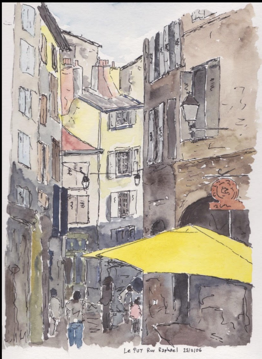
Le parasol Rue Raphael Le Puy