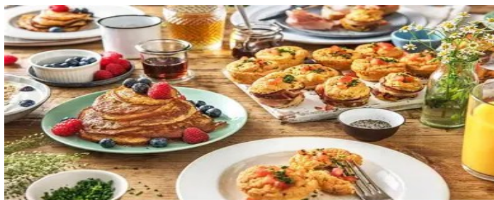
BRUNCH (s ou es)

Un scrabble avec une seule voyelle ? Si, c'est possible !