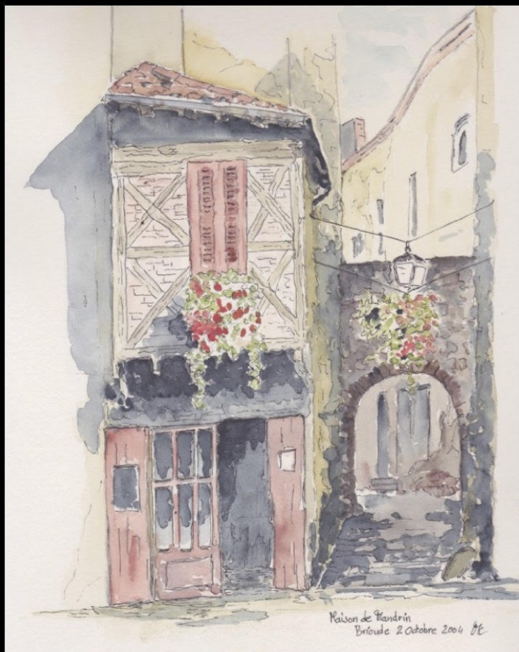
Maison de Mandrin Brioude Aquarelle encre de chine 26,5 x 18,5 cm